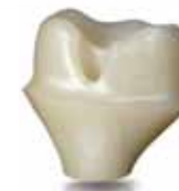
Ind. Abutment für Titanbasis