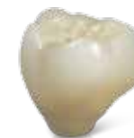
Ind. Abutment inkl. Krone für Titanbasis